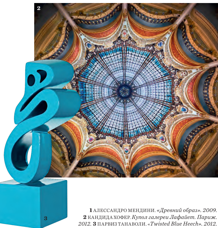
1 АЛЕССАНДРО МЕНДИНИ. «Древний образ». 2009. 2 КАНДИДА ХОФЕР. Купол галереи Лафайет. Париж. 2012. 3 ПАРВИЗ ТАНАВОЛИ. «Twisted Blue Heech». 2012.