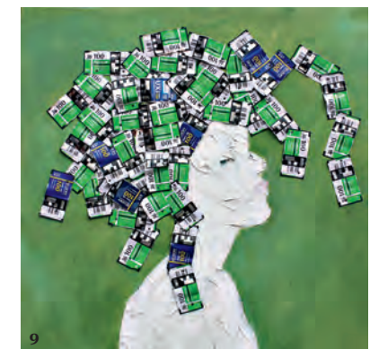
4 ХЕНРИ САГНА. «Другой мир возможен». 2012. 5 ГАБРИЭЛЬ КУРИ. «Без названия». 2012. 6 Галерея Nakkas на выставке DESIGN DAYS DUBAI. Март. 2012. 7 БЕН ХУН ЧОЙ. «Остаточное изображение». 2009. 8 ЛУИ ДУРО. «Спиральное кресло». 1972. 9 ТАЙЕ ИДАХОП. «Серия «Голов» №6». 2012.

Привлекательной и непохожей на конкурентов ярмарку Art Dubai делает местный колорит. В городе самых высоких небоскребов и насыпных островов, который и сам по себе произведение искусства, всюду формируется художественная среда с районами компактного «проживания» галерей, а родственный нам журнал Harper's Bazaar Art Arabia уже выходит с периодичностью раз в два месяца. В середине марта, когда проводится Art Dubai, там очень тепло, но еще не жарко: пляжный отдых можно сочетать