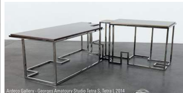
Ardeco Gallery - Georges Amatory Studio Tetra S, Tetra L 2014