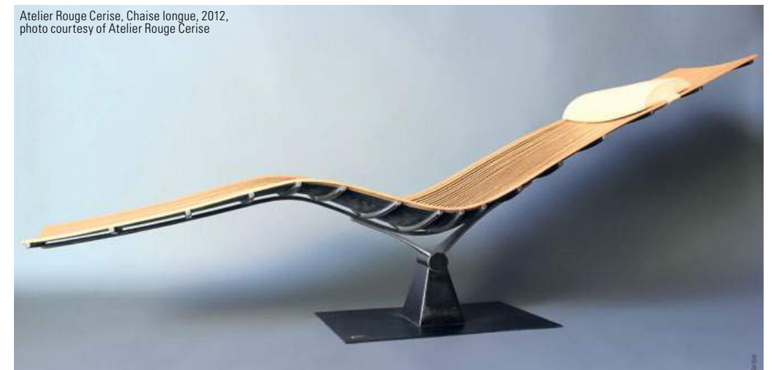
Atelier Rouge Cerise, Chaise longue, 2012, photo courtesy of Atelier Rouge Cerise

CZ - Of course we are happy that, like in all fairs, transactions occur. Galleries start new commercial connections, clients are satisfied and the artists are comforted in their artistic choices. However the concept of the fair is mainly to present unique objects that enable the public to discover new approaches, materials, techniques, to which they are not always used. What differs between art and design is that art creates things, design creates useful things. That's what we explain to our neophyte visitors when we tell them about the know-how of an artist, the contribution of a young designer or the value of an artist on the market. We tell them that if they do take the leap