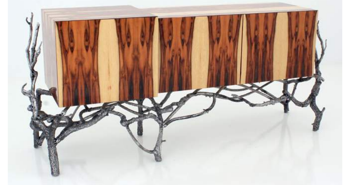
Nakash Gallery - Jorge Moura, Sideboard 2, Wood with metal base, 2011

Design Days Dubai, du 16 au 20 mars 2015, The Venue, Downtown Dubai (près du Burj Khalifa). www.designdaysdubai.ae