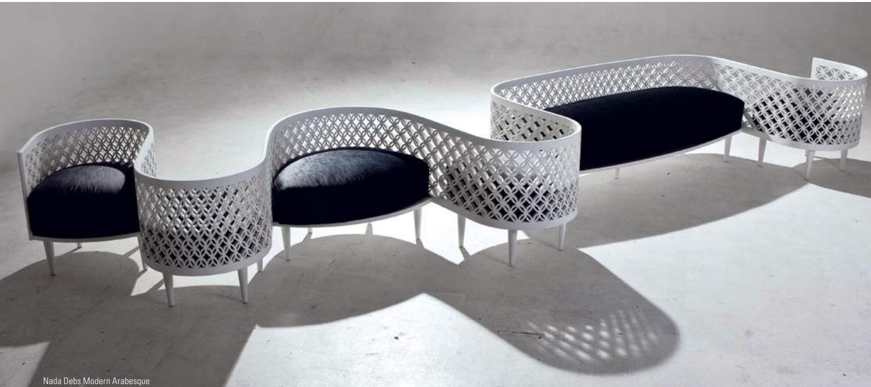
Nada Debs Modern Arabesque