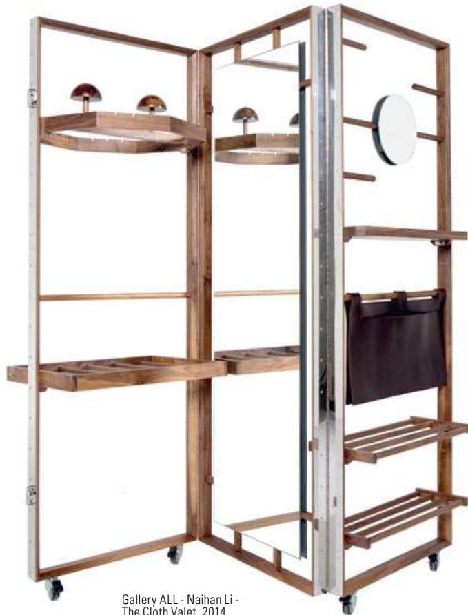
Gallery ALL - Naihán Li - The Cloth Valet, 2014

I might just add that in Dubai, unlike other fairs, people follow their impulse and buy: when they like an object, they appreciate it and buy it spontaneously. Not because it is part of a trendy list.