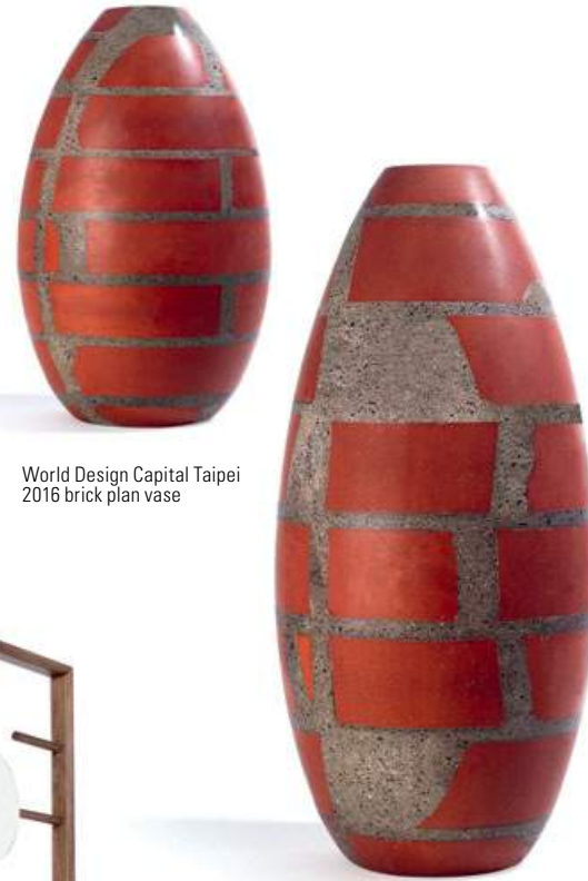
World Design Capital Taipei 2016 brick plan vase

Je pourrais aussi ajouter qu'à Dubaï, contrairement à d'autres foires, les gens font des achats coups de cœur : ils aiment un objet, l'apprécient et l'achètent de manière spontanée et non parce qu'il fait partie d'une liste d'objets qu'il faut absolument avoir.