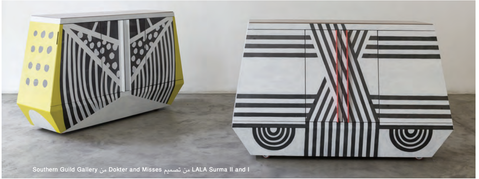
Southern Guild Gallery من Dokter and Misses تصميم من LALA Surma II and I