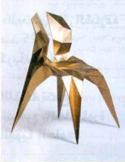
كرسي منكر للمصمم الصيني زو جي زاغ