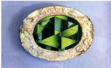
مراة من تصميم سام ميللر